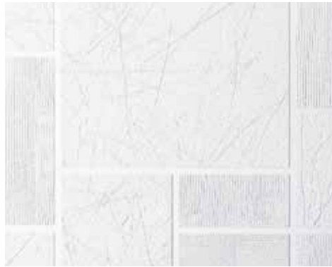
COMPOSITION L 400-1000 | H 700-2500