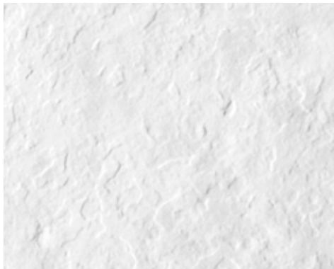
PIZARRA L 400-1300 | H 700-2500

Las especificaciones técnicas están sujetas a cambios sin previo aviso. Tolerancias dimensionales +/-5 mm.