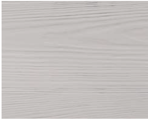
MADERA L 400-1000 | H 700-2500