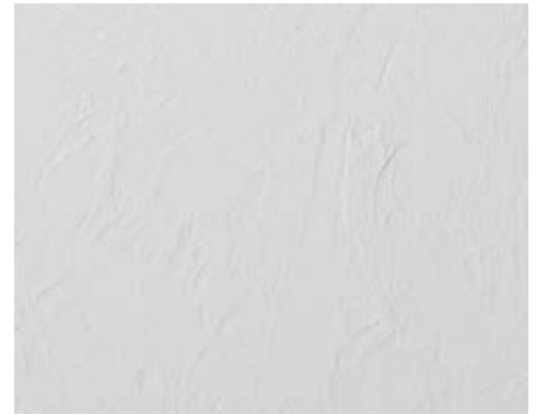
STREET L 400-1000 | H 700-2500