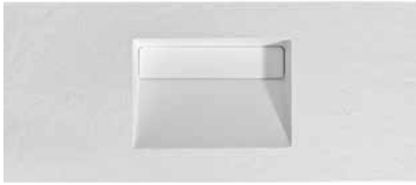
PIZARRA | LISO A 600-2000 | B 400-600