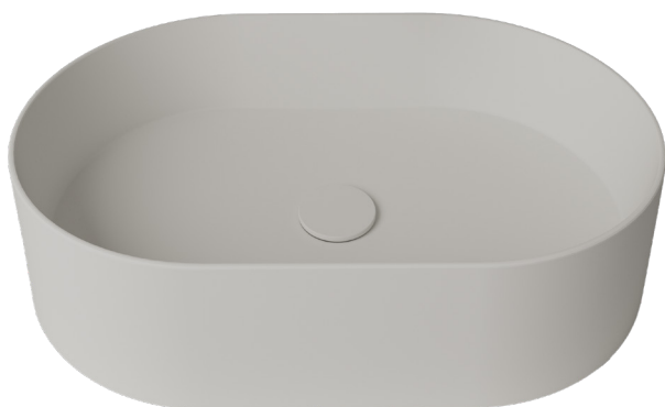
TEXTURA LISA 56x37cm h13cm