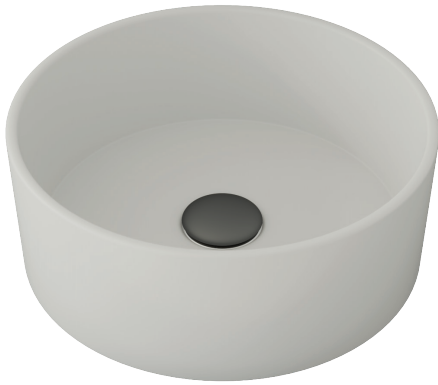
TEXTURA LISA ø37cm h13cm