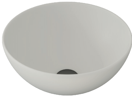
TEXTURA LISA ø40cm h16 cm